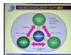
NACSEコンソシアムジャパンのメンバー構成